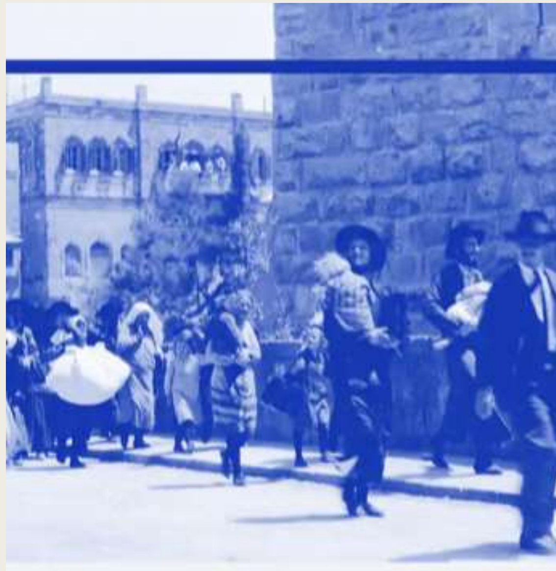
Εβραϊκές οικογένειες που διαφεύγουν από την παλιά πόλη της Ιερουσαλήμ.