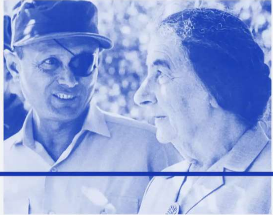
Πρωθυπουργός του Ισραήλ, η Golda Meir (R) με τον υπουργό Άμυνας Moshe Dayan.